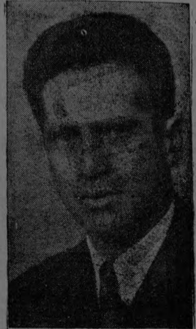
Lic. D. Benjamín Odio Ministro de Relaciones Exteriores