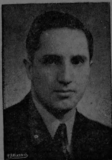
Lic. D. Alberto Marten Ministro de Economía, Hacienda y Comercio