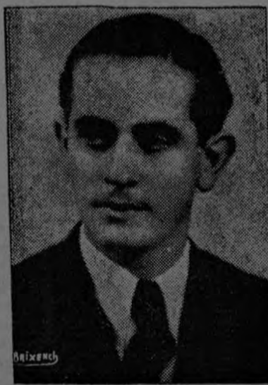
D. Bruce Masís Ministro de Agricultura e Industrias