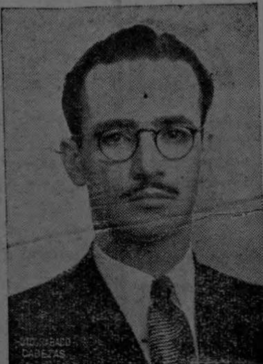
Lic. D. Gonzalo Facio Ministro de Justicia y Gracia