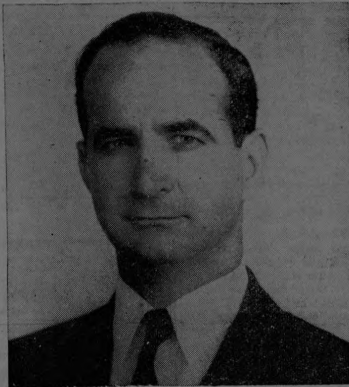
DON JOSE FIGUERES FERRER

Presidente de la Junta de Gobierno de la Segunda República y Comandante en Jefe del Ejército.