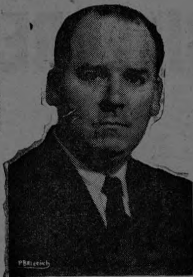
D. Fernando Valverde Ministro de Gobernación