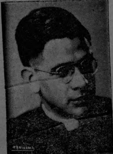
Pbro. D. Benjamín Núñez Ministro de Trabajo y Previsión Social