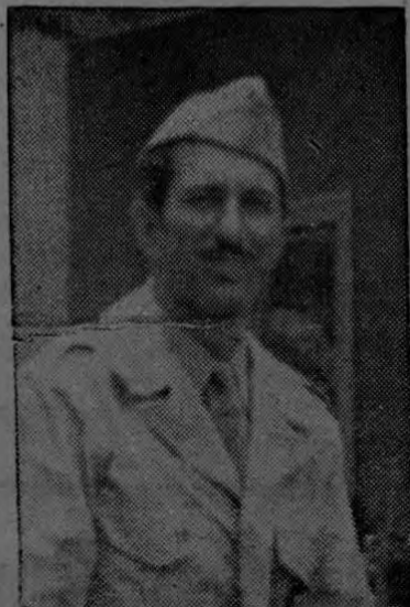
D. Edgar Cardona Ministro de Seguridad Pública